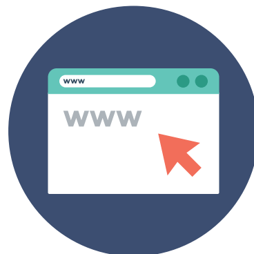
Portal RCC Brasil