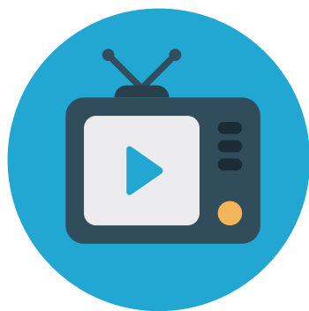
Programa Celebrando Pentecostes